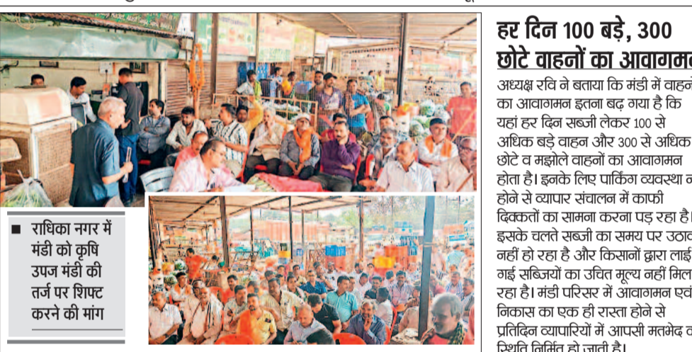
राधिका नगर में मंडी को कृषि उपज मंडी की तर्ज पर शिफ्ट करने की मांग